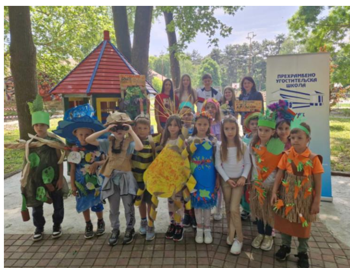
На учешћу у радионици „Вертикалне баште – уметност живљења“

Радионица је одржана у Научном парку „Регионалног центра за стручно усавршавање“ у термину од 10 до 13 часова.